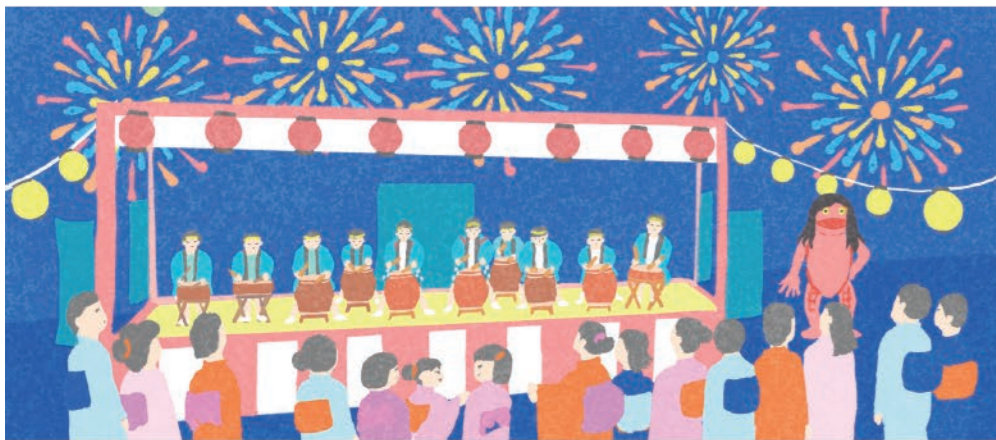
姫路信用金庫 2023年カレンダー 曾根天満宮秋祭り / 福崎夏祭り