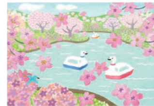
アクティブ企画 桜モチーフポストカード4種