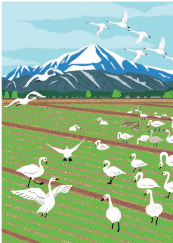
オリジナル 長浜 / 戸隠鏡池 / 神戸の海