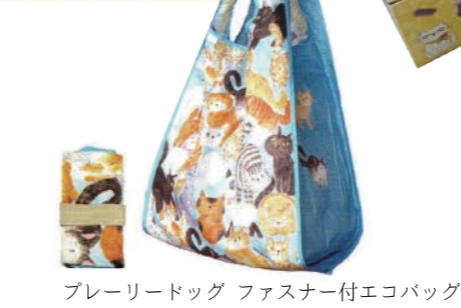
プレーリードッグ ファスナー付エコバッグ