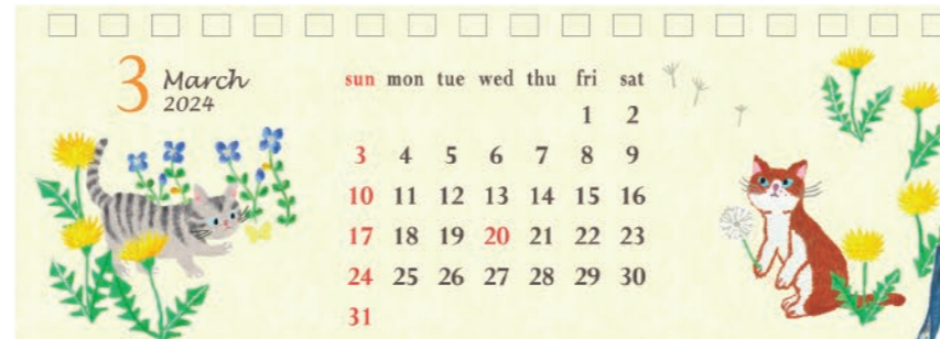
アクティブ企画 2024年卓上カレンダー