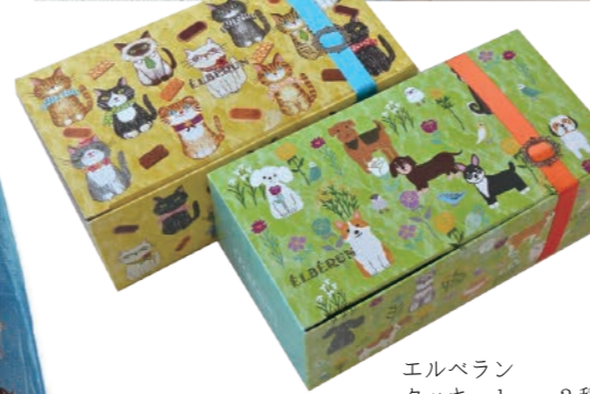
エルベラン クッキー box x 3種